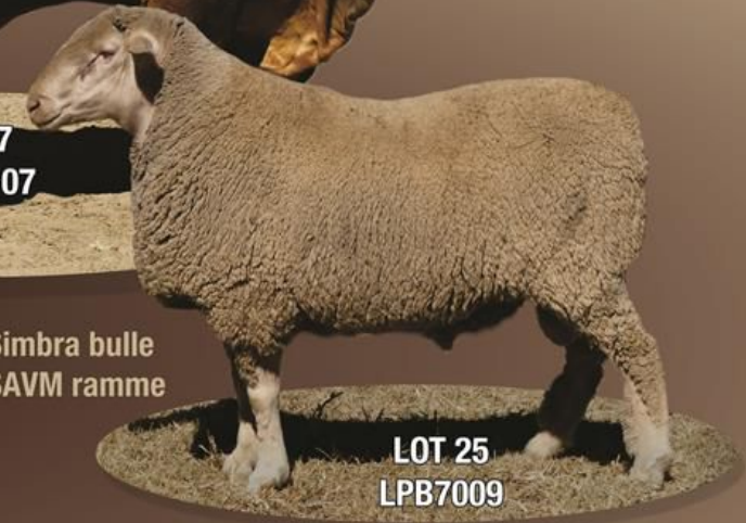
LOT 25 LPB7009

20 Geregistreerde Simbra bulle 25 Geregistreerde SAVM ramme