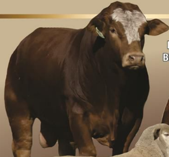
LOT 33 BEC1748