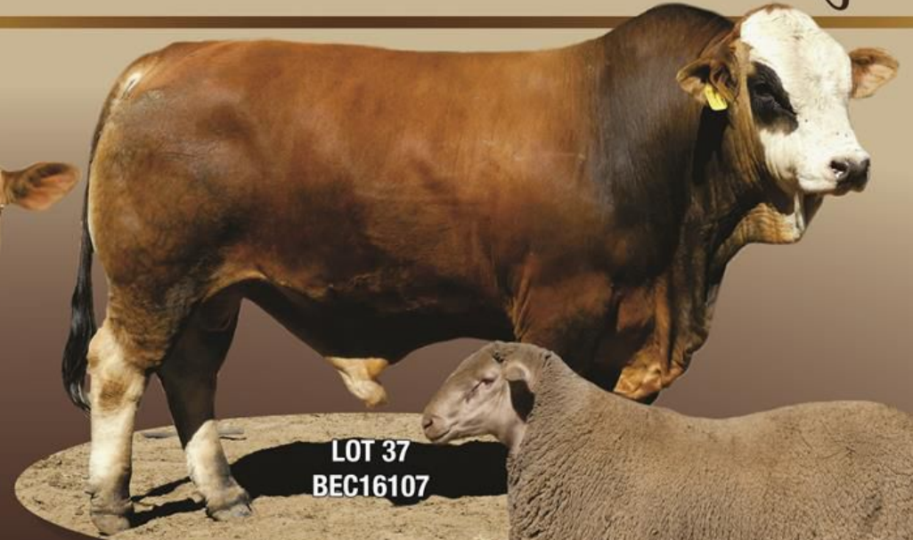
LOT 37 BEC16107

20 Geregistreerde Simbra bulle 25 Geregistreerde SAVM ramme